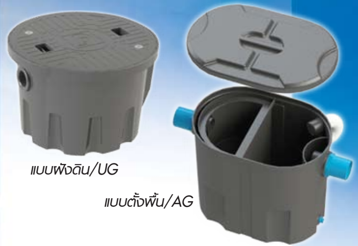
แบบฝังดิน/UG

ใช้สำหรับการดักไขมันจากครัวของบ้านพักอาศัย หรือร้านอาหาร ก่อนปล่อยน้ำเข้าสู่ระบบบำบัดน้ำเสีย ผลิตจากวัสดุ Polyethylene 100% แข็งแรงทนทานต่อการใช้งาน สามารถดักไขมันและช่วยลดมลภาวะทางน้ำได้ รวมถึงป้องกันการปนเปื้อนของไขมันสู่แหล่งน้ำธรรมชาติ และเพื่อประสิทธิภาพสูงสุดของการรักษาสิ่งแวดล้อม (ควรใช้ควบคู่กันกับถังบำบัด SATS P.P.)