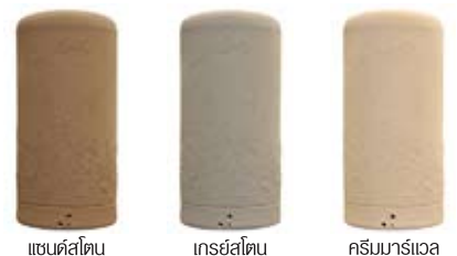
แชมเปญ ไทเทเนียม ครีมนาร์เดอ

สีของผลิตภัณฑ์อาจแตกต่างจากรูปตัวอย่าง เนื่องจากกระบวนการพิมพ์