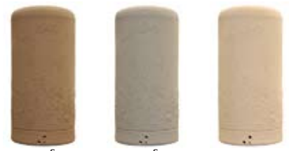
แซนด์สโตน เกรย์สโตน ครีมนาร์เวจ

สีของผลิตภัณฑ์อาจแตกต่างจากรูปตัวอย่าง เนื่องจากระบบการพิมพ์